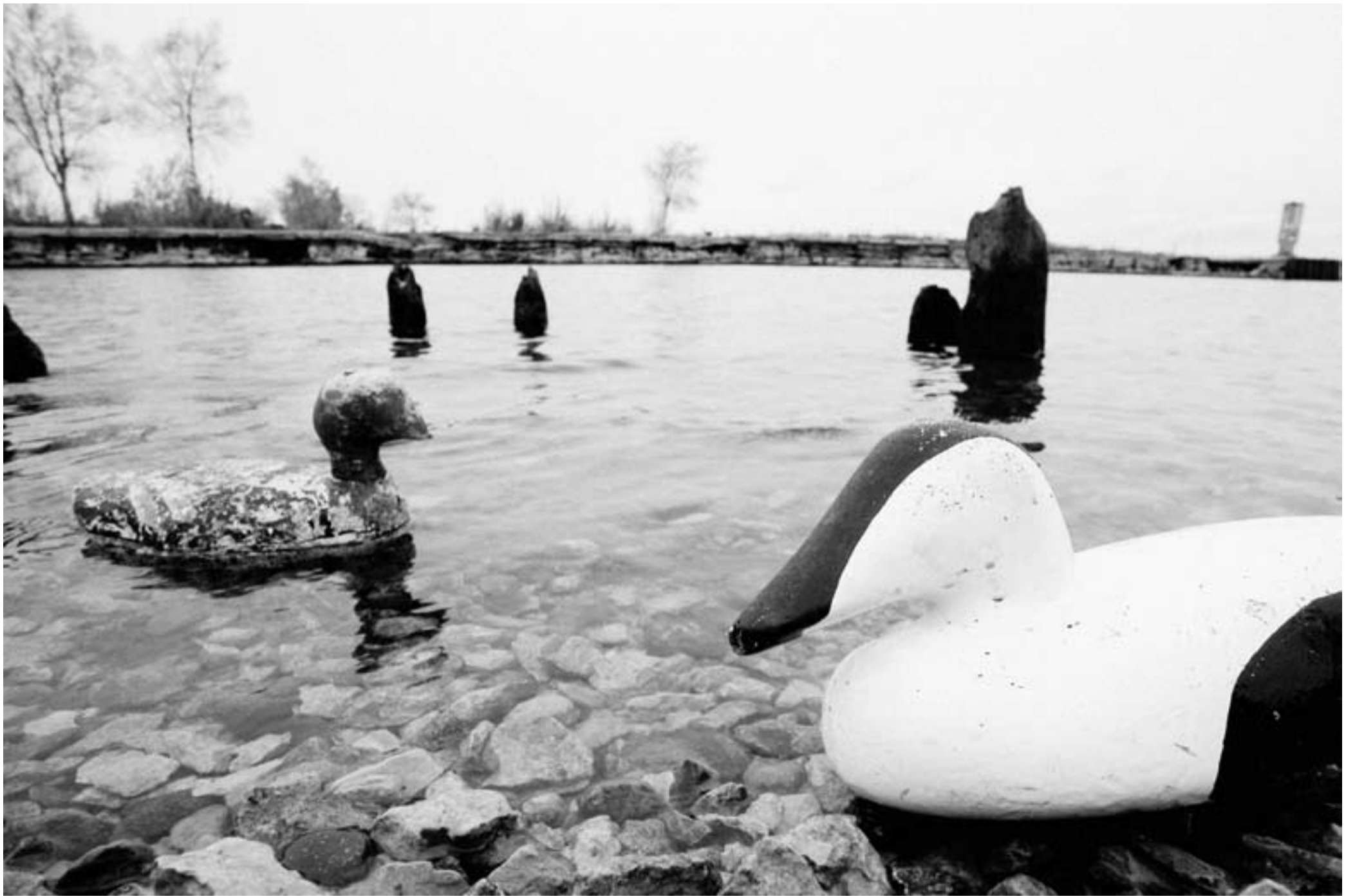
Tallinna mereäär kolm aastat enne kultuuripealinnaks saamist